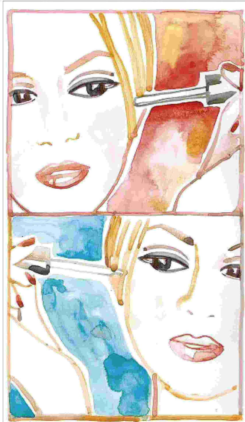
ILLUSTRAZIONE DI NATALIA RESMINI